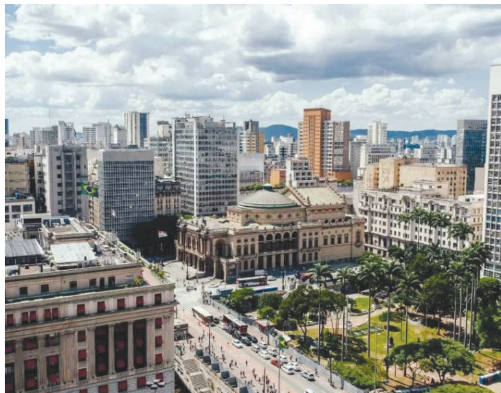
A Prefeitura de São Paulo, por meio da Secretaria Municipal de Cultura e Economia Criativa e da Spcine,

em 30 de setembro, R$ 80 milhões para o audiovisual da capital. O aporte foi viabilizado a partir da deliberação do Conselho Gestor do Fundo Setorial do Audiovisual (FSA), que aprovou R$ 60 milhões em recursos para a cidade, somados à contrapartida municipal de R$ 20 milhões.